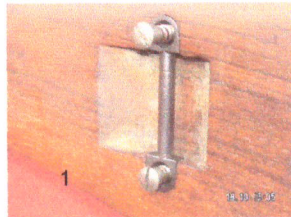
Riegel für Riemenfrosch